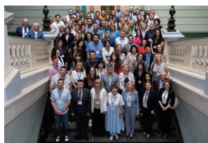
Представники МЕГУ на Міжнародній конференції м. Львів

Іноземні колеги беруть не тільки активну участь в освітньо-науковій діяльності МЕГУ, але й з початком повномасштабного вторгнення росії в Україну постійно надають гуманітарну допомогу. Колектив та студенти МЕГУ висловлюють щирю вдячність за підтримку та допомогу Україні.