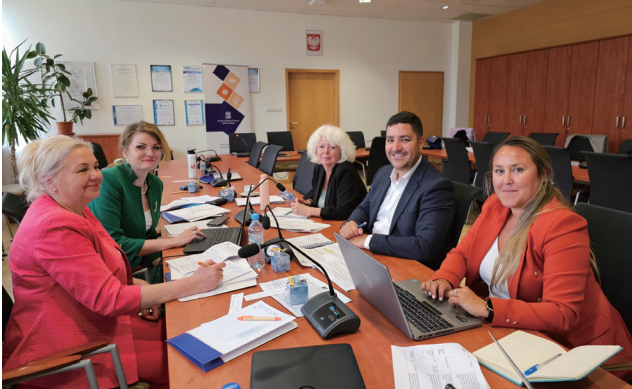
Представники МЕГУ на воркшопі «Я голосую за мир», Університет Адама Міцкевича, м. Познань

Однією з основних стратегій розвитку ПВНЗ «Міжнародний економіко-гуманітарний університет імені академіка Степана Дем'янчука» є інтернаціоналізація освітньої діяльності університету. За 30-ть років діяльності вищій навчальний заклад налагодив плідну співпрацю з понад 32 іноземними закладами вищої освіти.