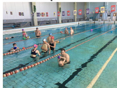
Басейн МЕГУ імені академіка С. Дем'януха

Спортивно-оздоровчий комплекс імені професора В. Завацького є гарною базою для підготовки фахівців у галузі фізичної культури і спорту та здоров'я людини. Тут функціонують 25-метровий басейн на шість доріжок, зал спортивних ігор, масажний зал фізичних процедур, зал атлетичної гімнастики, спеціалізований майданчик із синтетичним покриттям, зал хореографії і оздоровчої гімнастики. На базі комплексу підвищують свою спортивну майстерність студенти МЕГУ, учні ДЮСШ, а також спортсмени-інваліди. Тренується збірна області з плавання, жіноча волейбольна команда Вищої ліги «Регіна», збірна команда з мініфутболу.