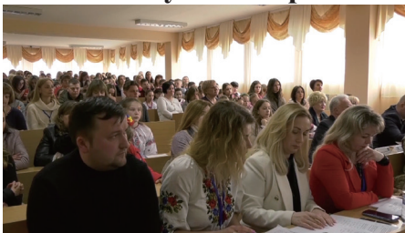
XXVII Міжнародні громадські учнівські читання «Я голосую за мир»

Молодь за мир: XXVII Міжнародні громадські учнівські читання «Я голосую за мир» є частиною проекту «Я голосую за мир: співпраця та співчуття під час війни», який реалізується спільно з Університетом Бат Спа за підтримки Research England та Міністерства досліджень та інновацій Великої Британії.