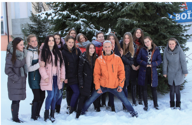
Дозвілля студентів МЕГУ факультету журналістики

У світі дуже багато вищих навчальних закладів і я впевнена, що кожен з них по своєму гарний. Але все-таки є один, який особисто для мене, має дуже велике значення – це Міжнародний економіко-гуманітарний університет імені академіка Степана Дем'янчука