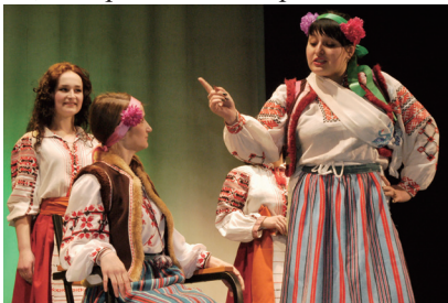
Студентський театр «Бриз» ім. Богдана Денисюка

За тридцятирічну діяльність університету центр ЕГВСМ МЕГУ став центром молодіжного дозвілля, що розвиває творчі здібності