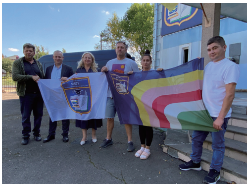
Волонтерська діяльність професорсько-викладацького колективу МЕГУ

З перших днів війни працівники ПВНЗ «МЕГУ імені академіка Степана Дем'янчука» є активними учасниками волонтерського руху.