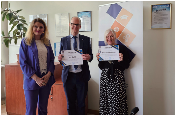
Викладачі МЕГУ в Університеті Адама Міцкевича, Республіка Польща, м. Познань

Наукова робота МЕГУ впродовж тридцяти років спрямована на підготовку фахівця здатного до дослідницько-інноваційного типу мислення, творчої самореалізації, розв'язання гуманітарних, соціально-економічних, комп'ютерно-технологічних проблем.