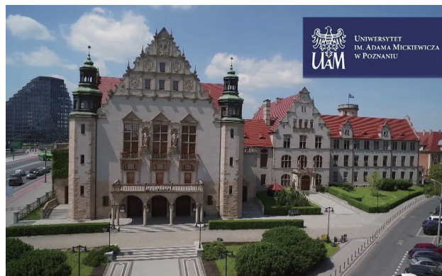
Університет Адама Міцкевича Республіка Польща

Практично реалізовуватися співпраця буде через розробку спільних освітніх програм, двосторонній обмін викладачами та студентами з метою підвищення професійного рівня, стажування та практики, взаємне інформування про навчальні програми та проведення наукових заходів, організацію наукових конференцій та видавництво наукових збірників.