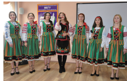
Ансамбль народної пісні «Зорецвіт» МЕГУ

З метою розвитку й вдосконалення найкращих комунікативно-організаторських