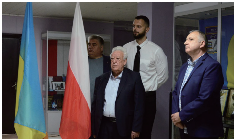
Відкриття Польсько-українського адаптаційного центру на базі МЕГУ

У рамках такого побратимства МЕГУ та Bath Spa University виграли спільний грант на реалізацію проєкту «Я голосую за мир: співпраця та співчуття під час війни». У результаті вже було проведено спільний міжнародний захід з Британськими партнерами та іншими Європейськими учасниками з метою підтримки України та пропагування миру.