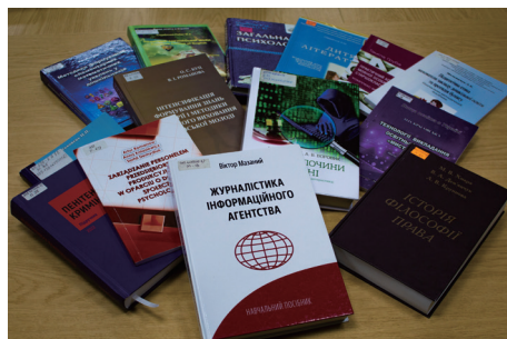
Наукові праці викладачів МЕГУ імені академіка С. Дем'янчука

В університеті активно функціонує Студентське наукове товариство та Рада молодих учених, які залучені до реалізації міжнародних наукових проєктів.