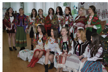
Студенти МЕГУ беруть участь в щорічному конкурсі колядників та щедривників

Для здобувачів вищої освіти в університеті створено всі необхідні умови, щоб студентське життя було цікавим, комфортним та затишним.