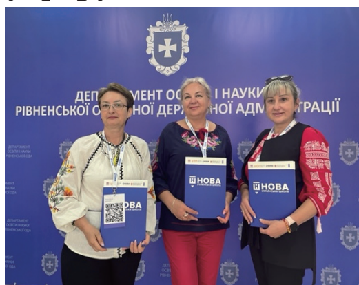
Науково-педагогічні працівники університету взяли участь в освітньому форумі

У рамках практичної платформи «Творча майстерня НУШ» науковці університету мали можливість ознайомитися з освітніми майстернями: «Ментальне здоров'я: як подбати про себе та інших»; «Іграшкова терапія у подоланні травматичного стресу війни»; «Діяльнісний підхід як ДНК оновлення української школи»; «Використання програмного комплексу «Mozaik» вчителем»; «Навчитися керувати безпілотними літальними апаратами у ЗСО: міф чи реальність»; «Використання 3D технологій в освітньому про-